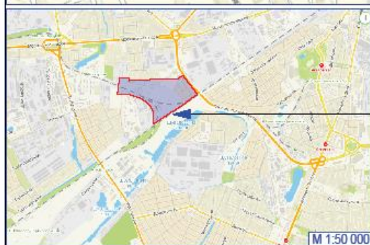
Территория в границах подготовки проекта планировки