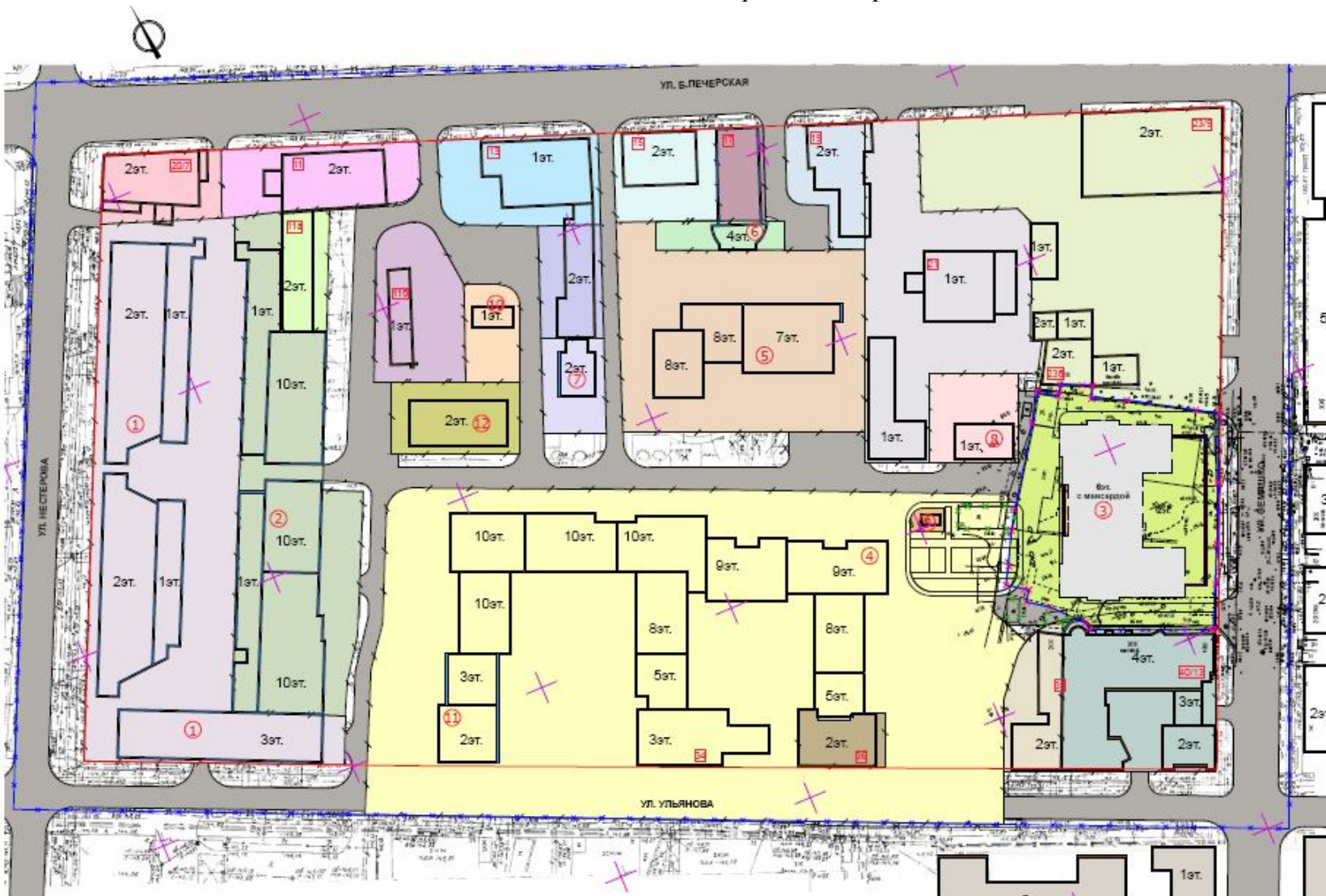
Схема очередности строительства