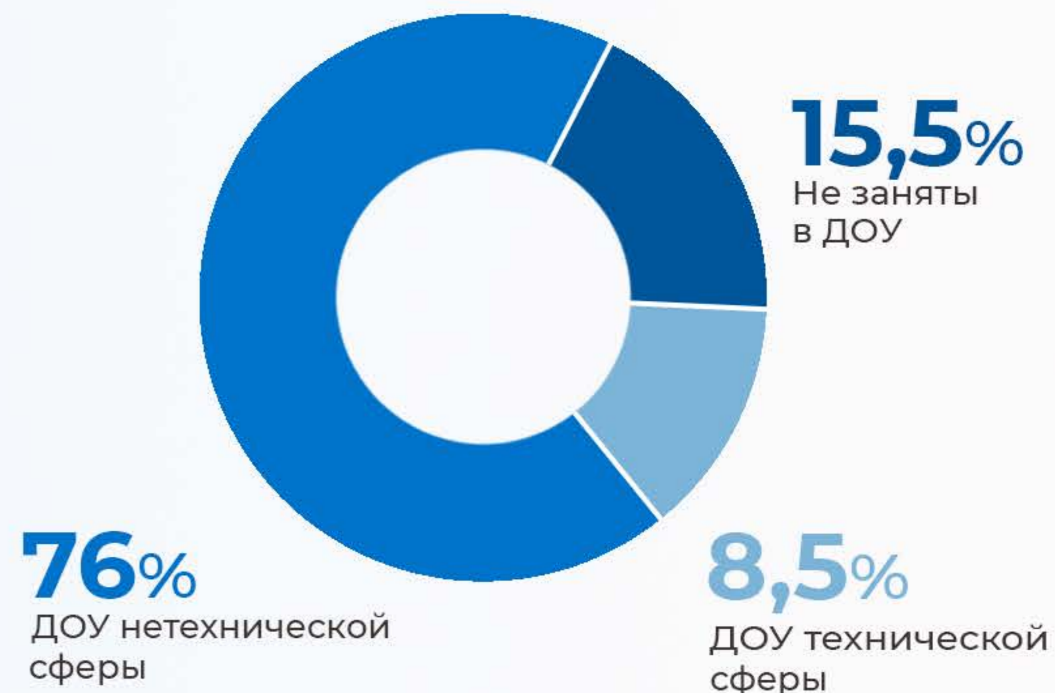
Дополнительное образование учащихся Нижегородской области (ДОУ)