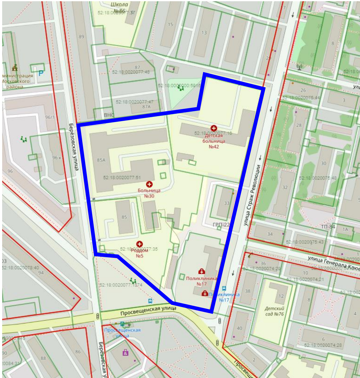
Схема границ подготовки документации по планировке территории