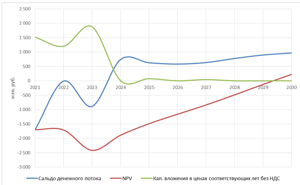
Рисунок 4.1 - Результаты оценки эффективности полного состава проектов в зоне АО «Теплоэнерго»