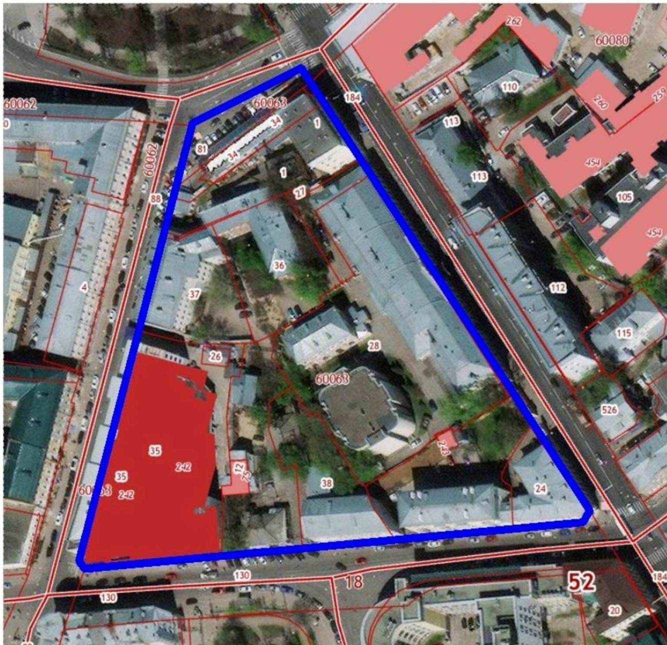
Схема расположения границ территории разработки проекта межевания территории в границах улиц Варварская, Пискунова, Алексеевская, площади Минина и Пожарского в Нижегородском районе города Нижнего Новгорода приведена на Рисунке 1:

Проект межевания территории разработки проекта межевания территории в границах улиц Варварская, Пискунова, Алексеевская, площади Минина и Пожарского в Нижегородском районе города Нижнего Новгорода разработан для территории площадью 2,11 га.