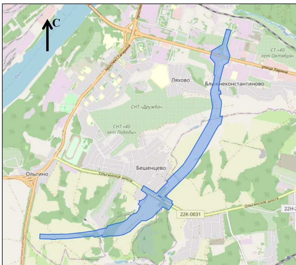
Схема границ подготовки проекта межевания территории (арх. № 117/23)

«ПРИЛОЖЕНИЕ к приказу министерства градостроительной деятельности и развития агломераций Нижегородской области от 4 мая 2022 г. № 06-01-02/51