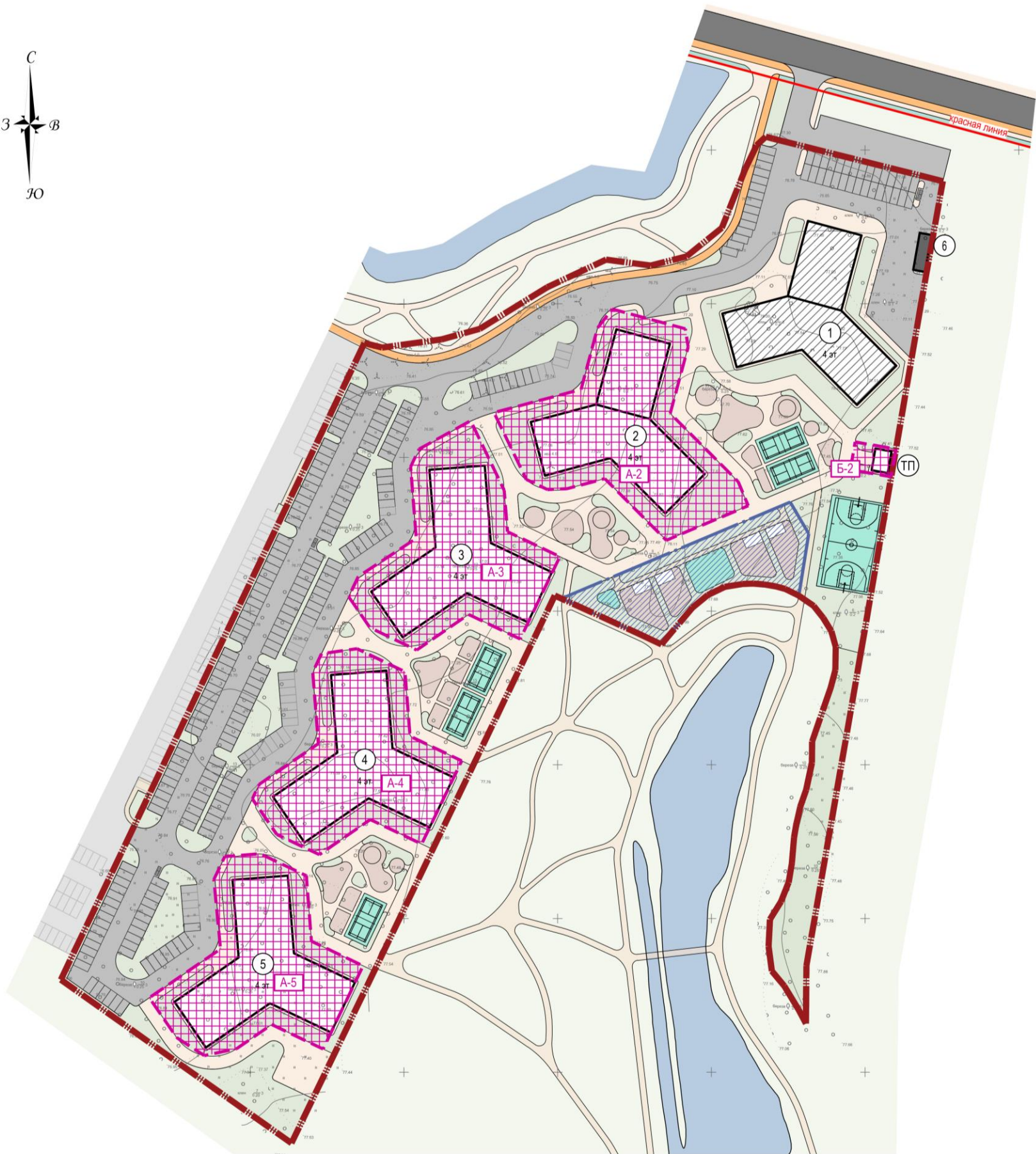
Экспликация зон планируемого размещения объектов капитального строительства

Условные обозначения существующих и планируемых элементов планировочной структуры