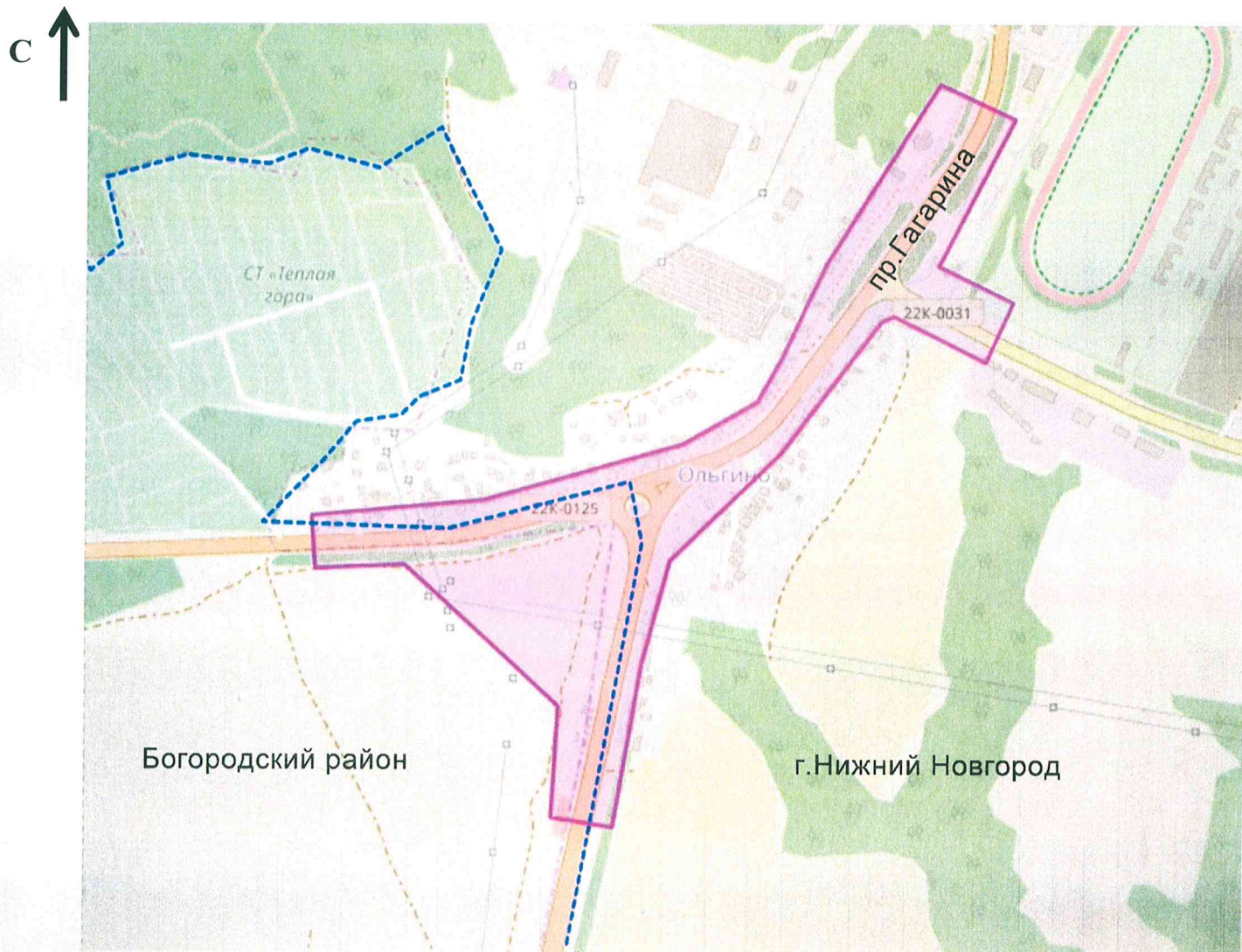
Схема границ подготовки документации по планировке территории (арх. № 89/19)