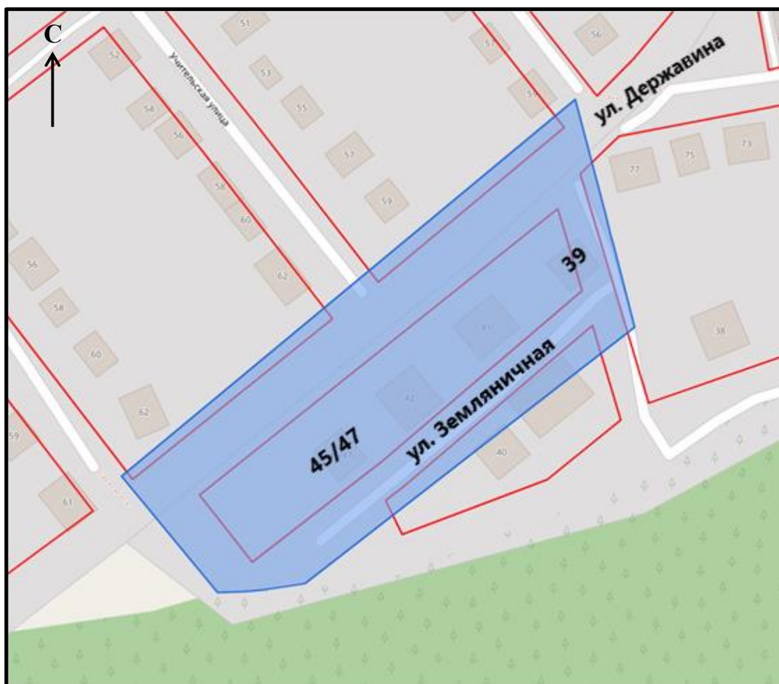
Схема границ подготовки проекта планировки территории (арх. № 122/24)