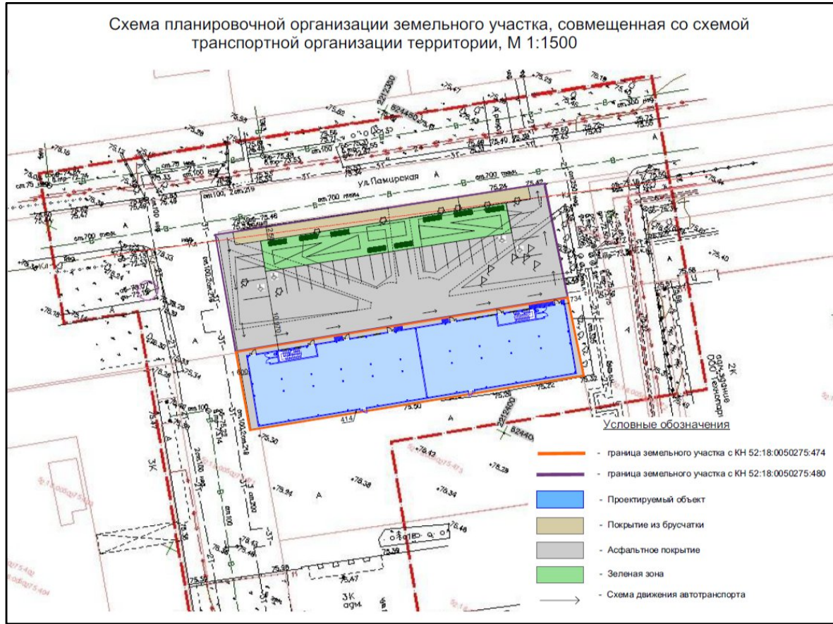
Схема планировочной организации земельного участка, совмещенная со схемой транспортной организации территории, М 1:1500