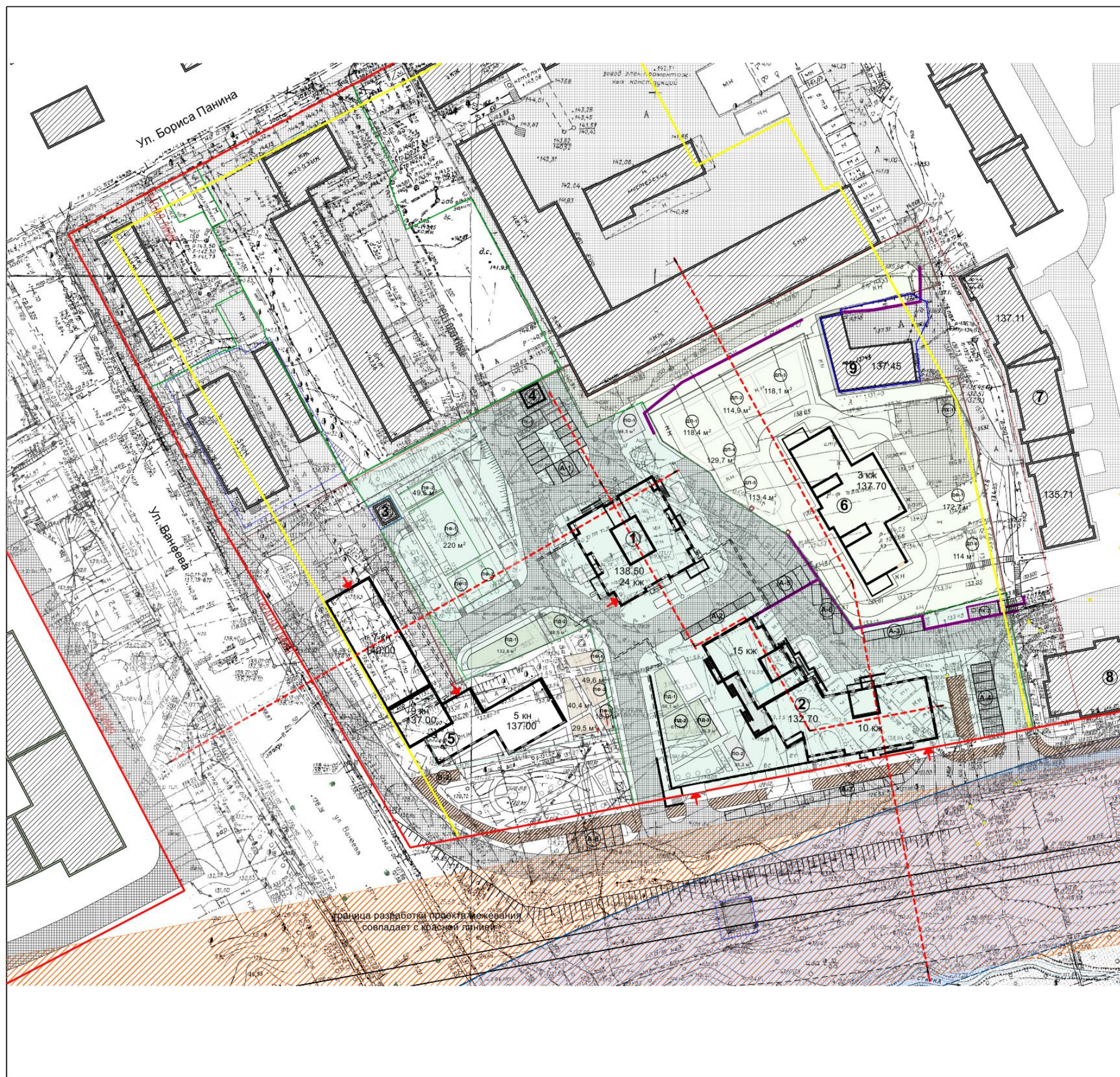
ЭКСПЛИКАЦИЯ ЗДАНИЙ И СООРУЖЕНИЙ (2 ОЧЕРЕДЬ)