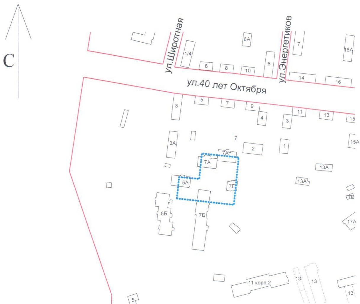
Схема границ подготовки проекта планировки и межевания территории (арх. № 262/16-2)