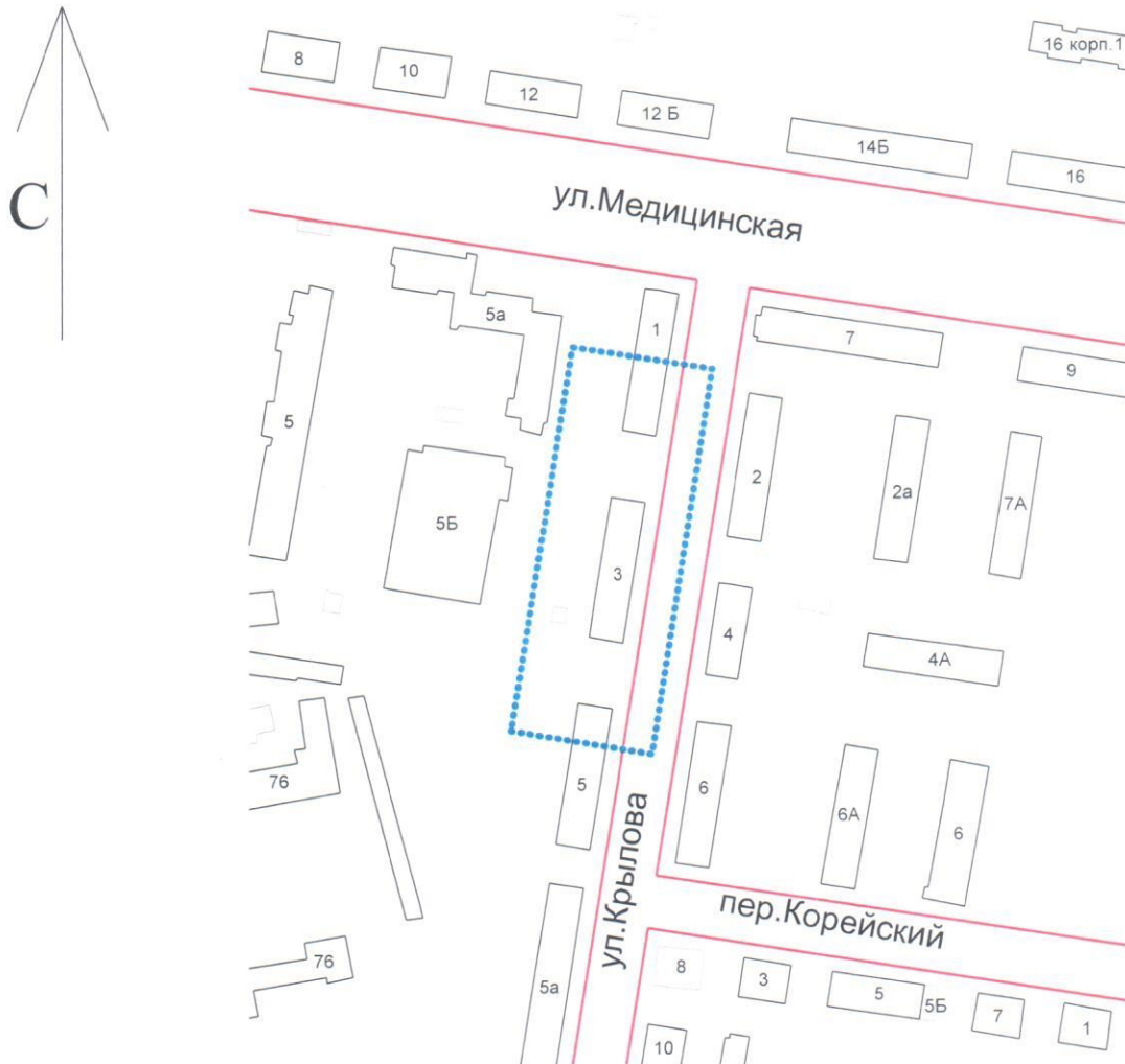
Схема границ подготовки проекта планировки и межевания территории (арх. № 262/16-5)