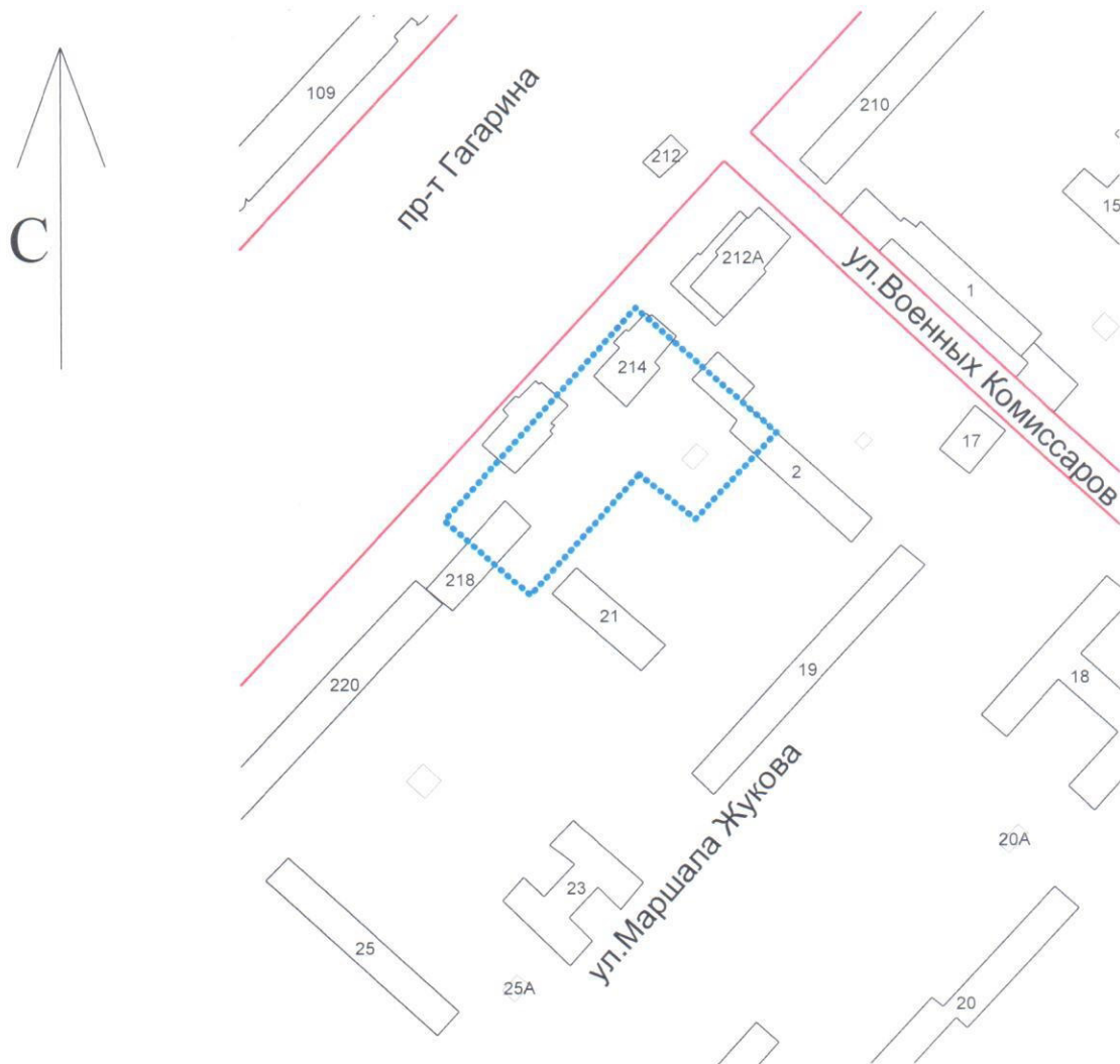
Схема границ подготовки проекта планировки и межевания территории (арх. № 262/16-6)