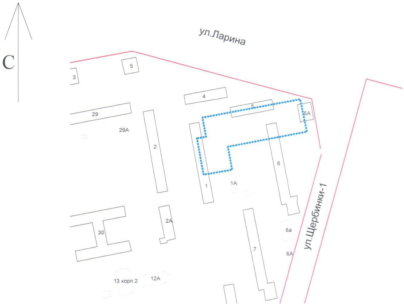
Схема границ подготовки проекта планировки и межевания территории (арх. № 262/16-4)