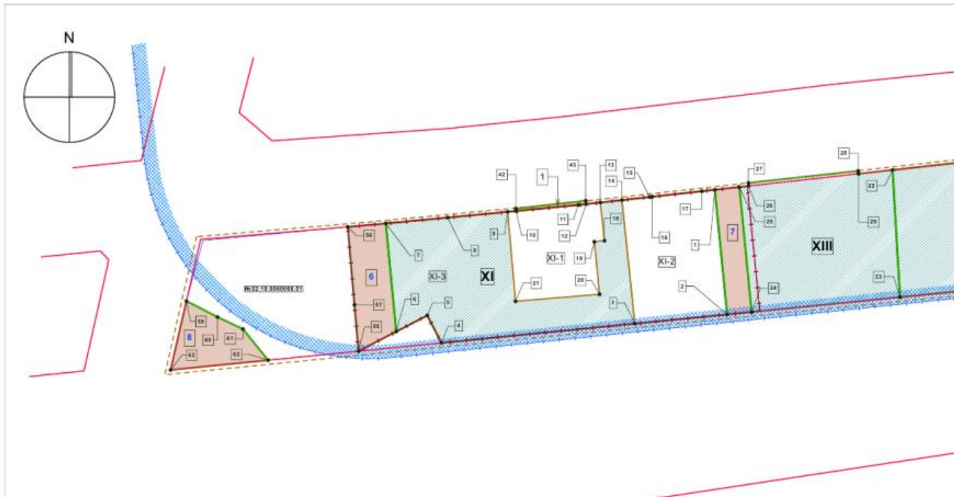
Экспликация образуемых и изменяемых земельных участков на кадастровом плане территории