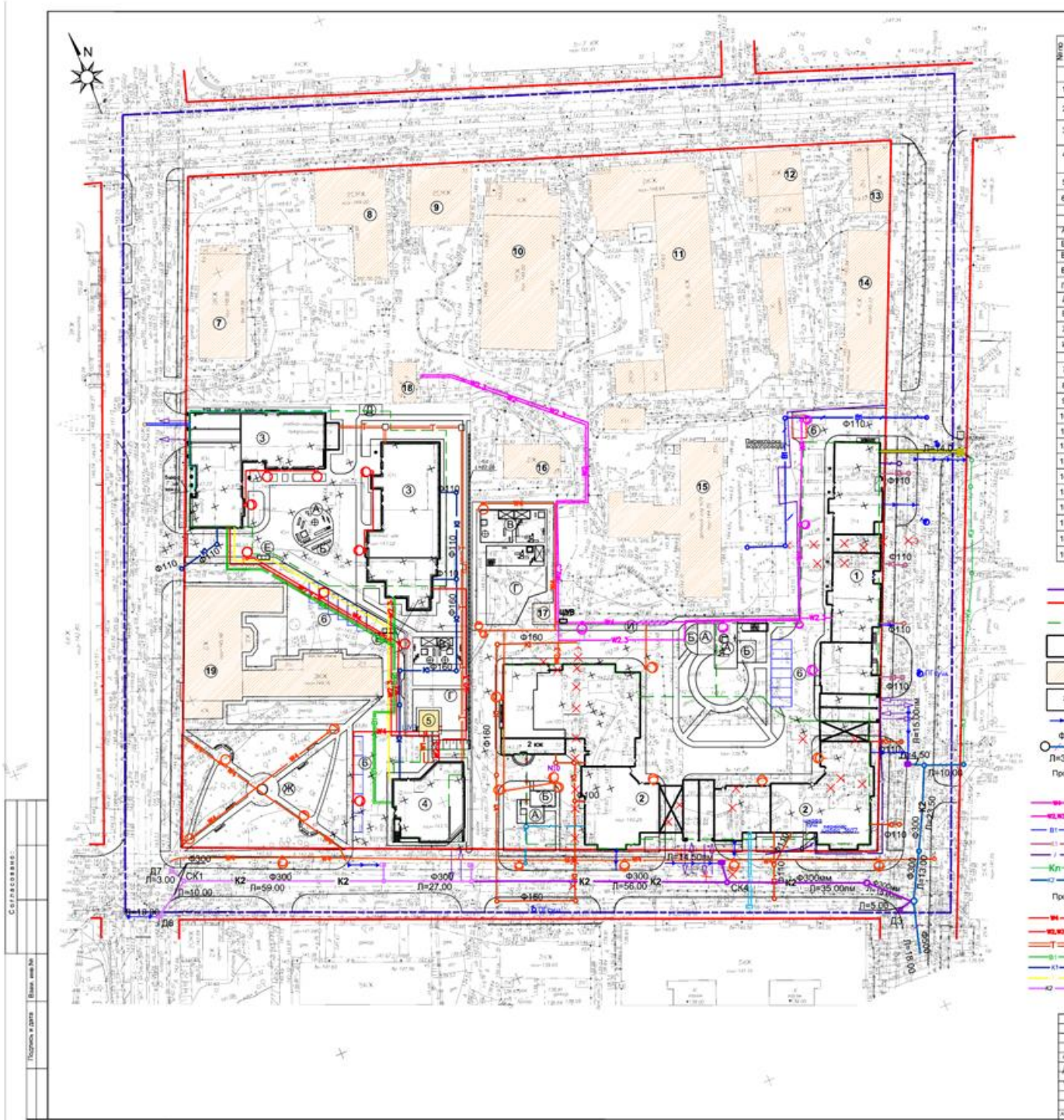
V. Чертеж межевания территории