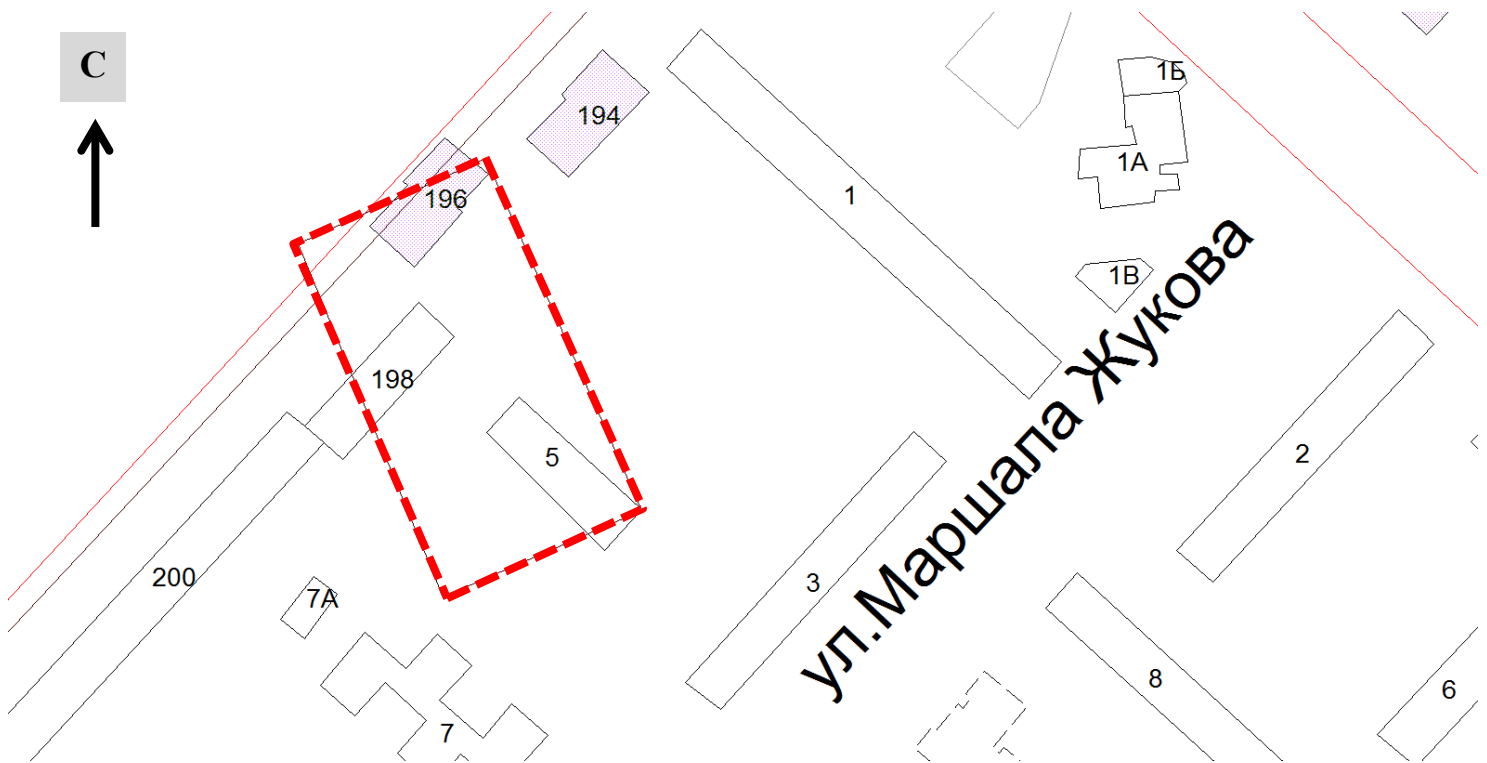
Схема границ подготовки проекта планировки и межевания территории (арх. №94/18)

ПРИЛОЖЕНИЕ к приказу департамента градостроительной деятельности развития агломераций Нижегородской области от 19 июля 2018 года №06-01-02/37