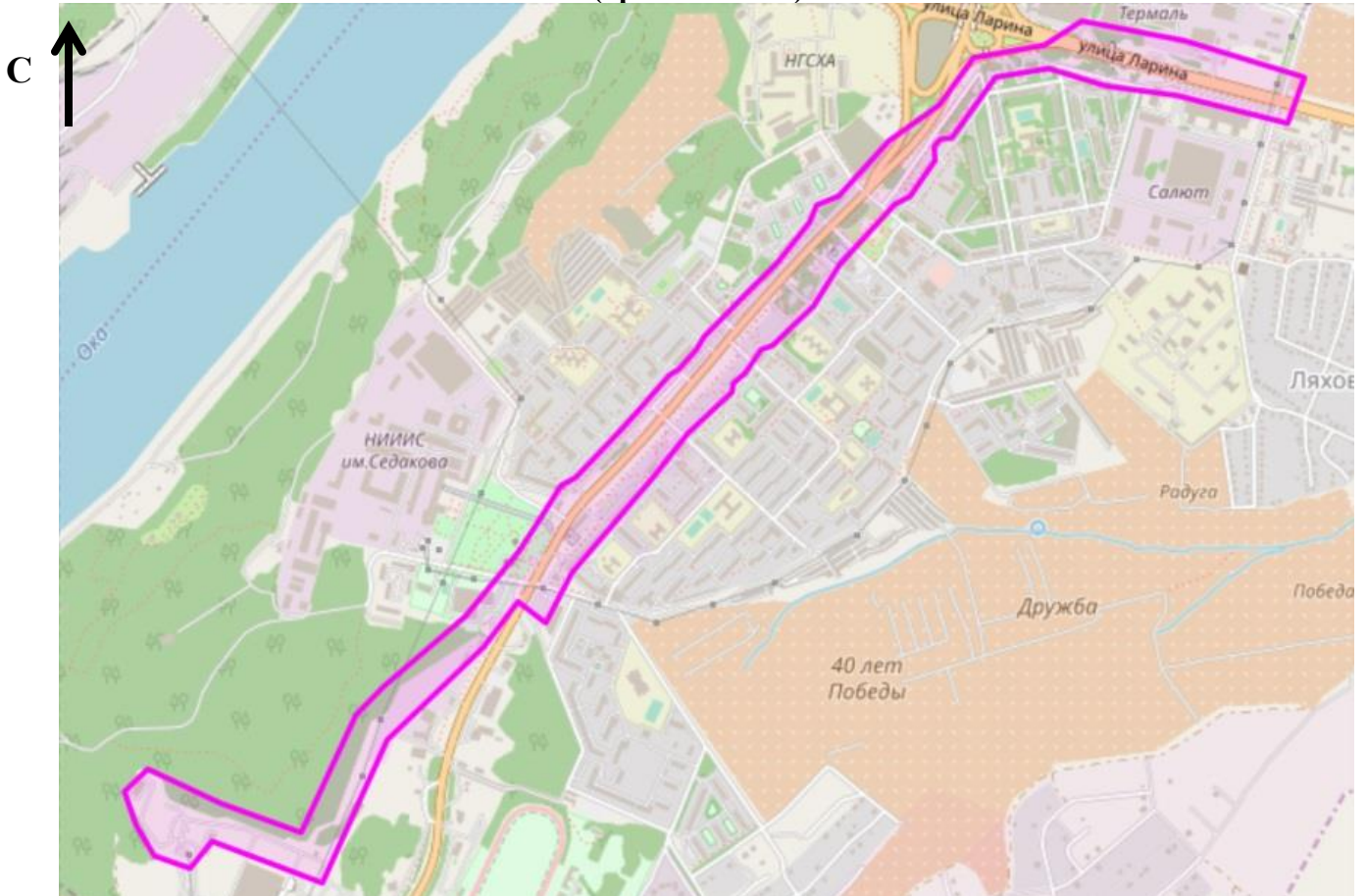
Схема границ подготовки проекта планировки и межевания территории (арх. № 174/18)

ПРИЛОЖЕНИЕ к приказу департамента градостроительной деятельности и развития агломераций Нижегородской области от 7 сентября 2018 года №06-01-02/55