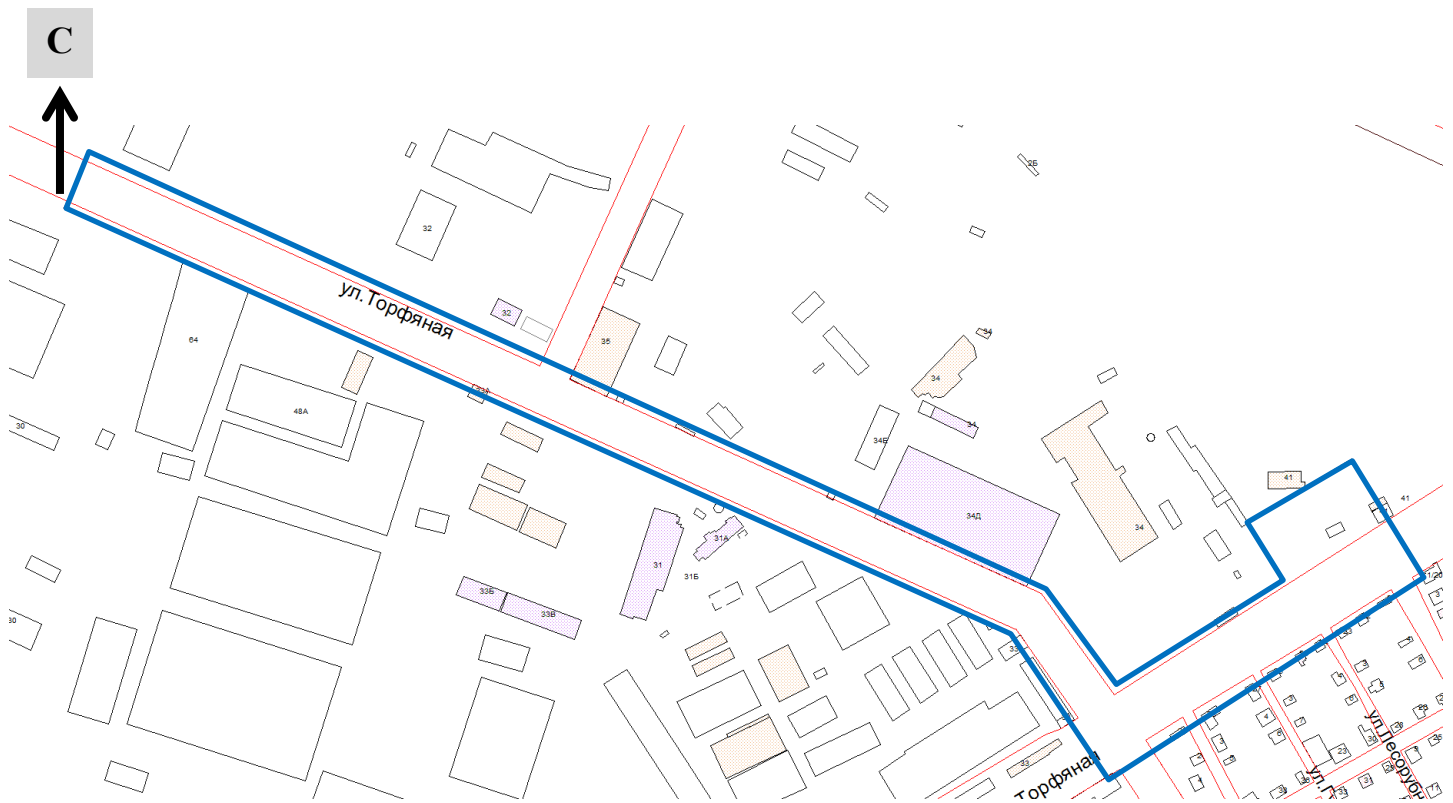
Схема границ подготовки документации по планировке территории (арх. №17/19)